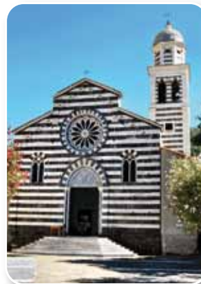
▲ La Chiesa di S. Andrea a Levanto

La notte del 13, quando le stelle cadenti ancora attraversano veloci il caldo cielo d'Agosto, una manifestazione imperdibile ha luogo nella splendida cornice di Levanto. In questo gioiello della natura, in prossimità della riserva naturale delle Cinque Terre, potrete trascorrere una notte stellata all'insegna del buon vino. L'allestimento principale dell'evento sarà proprio in riva al mare, alla spiaggia Sirena: da qui numerosi banchi disposti lungo i tipici carruggi liguri vi accompagneranno alla scoperta di luoghi e sapori ricchi di tradizione.