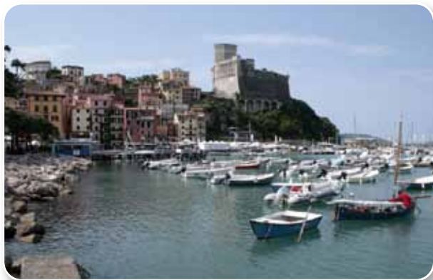
Il porto e il castello di Lerici